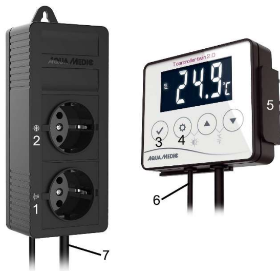
Fig. 1: T controller twin 2.0 PRO